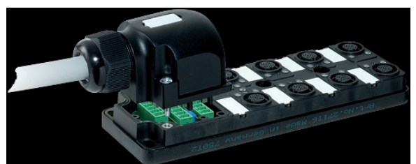
Beispiel Anschlussverteiler Murr Elektronik

Die digitalen Eingänge können mit einer Updaterate von ca. 30 Hz eingelesen werden.