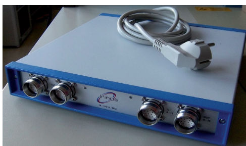
I/O-Box für I/O-Bus mit integriertem Netzteil

Die E/A-Boxen sind mit einem separaten Netzteil ausgestattet. Über M23-Steckverbinder können handelsübliche M12 E/A-Verteiler (z.B. Murr Elektronik) angeschlossen werden.