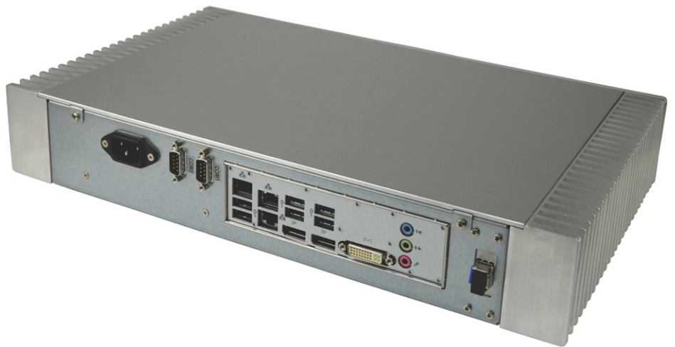
Rückseite mit ATX-Blende, RS232 und Netzanschluß, hier mit zusätzlichem LWL Netz- werk ( Fiber Gecko )