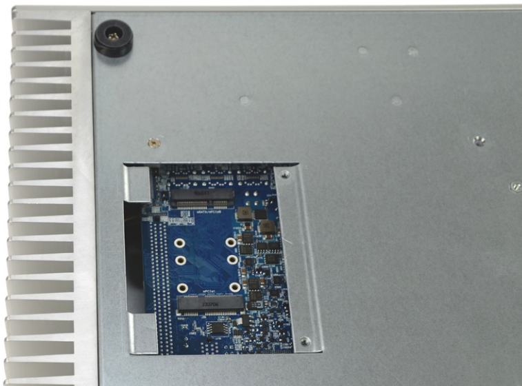
Unterseite Steckplatz für Mini-PCIe Karten